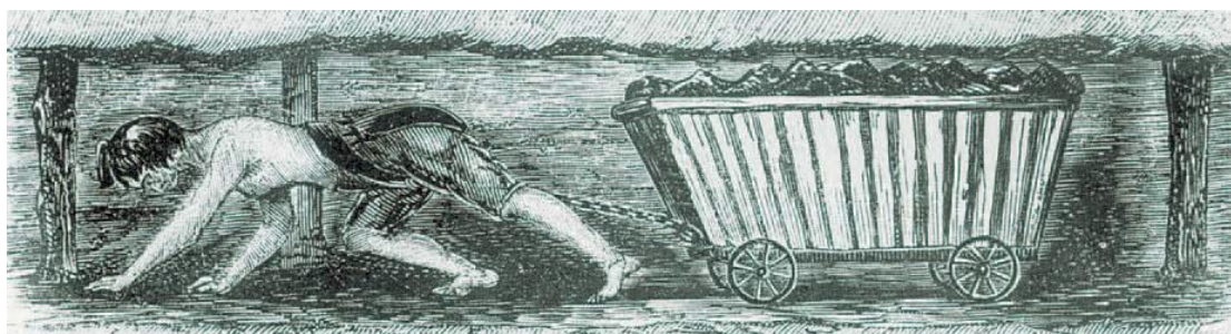
Παιδιά-εργάτες στα ανθρακωρυχεία της Αγγλίας την περίοδο της βιομηχανικής επανάστασης

E.J. Hobsbawm, Η εποχή των επαναστάσεων, μτφρ. Μ. Οικονομοπούλου, ΜΙΕΤ, Αθήνα 1990, σ. 279.