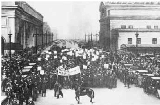
Σικάγο – Ο ματωμένος Μάης του 1886