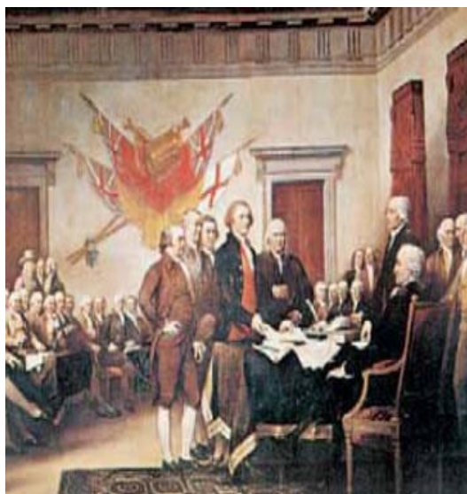
Τζ. Τράμπουλ, Η υπογραφή της αμερικανικής Διακήρυξης της Ανεξαρτησίας. Η 4η Ιουλίου αποτελεί εθνική γιορτή των ΗΠΑ.

Θεωρούμε ως αλήθειες αυταπόδεικτες ότι όλοι οι άνθρωποι πλάστηκαν ίσοι, ότι προκίστηκαν από τον Δημιουργό τους με μερικά अपαραράπτα δικαιώματα, όπως αυτά της ζωής, της ελευθερίας και της αναζήτησης της ευτυχίας. Για να εξασφαλιστούν αυτά τα δικαιώματα, καθιερώθηκαν οι κυβερνήσεις των ανθρώπων, αντλώντας τη δίκαιη εξουσία τους από τη συγκατάθεση των κυβερνωμένων. Όποτε οποιαδήποτε μορφή διακυβέρνησης έρθει σε αντίθεση με αυτές τις αρχές, είναι δικαίωμα του λαού να την αλλάξει ή να την καταργήσει και να καθιερώσει νέα κυβέρνηση βασισμένη σε αυτές τις αρχές και οργανωμένη με τέτοιο τρόπο, ώστε να θεωρείται από τον λαό πιο αποτελεσματική για την εξασφάλιση της ευτυχίας των πολιτών.