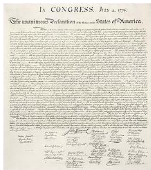
Η Διακήρυξη της Ανεξαρτησίας των ΗΠΑ