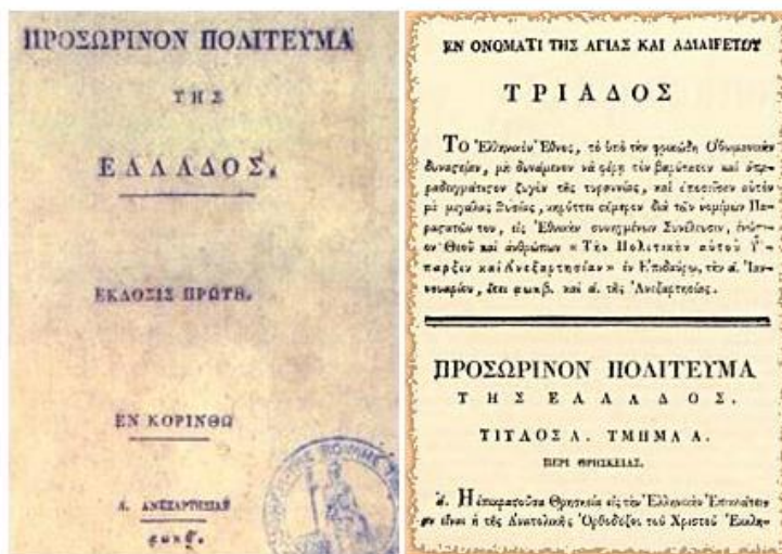
Το πρώτο Σύνταγμα της Ελλάδας